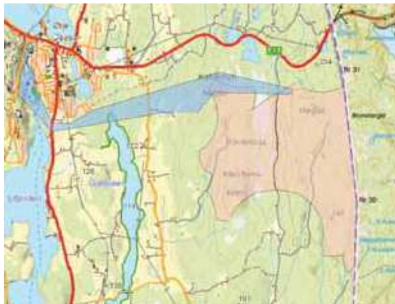
Kartutsnitt over området Høgås

I regionale planer som friluftsplaner og fylkesplan for Østfold utarbeidet av Østfold fylkeskommune og rapport 1-1993 Østfoldlandskap av regional betydning utarbeidet av Fylkesmannen i Østfold har skogsområdene mellom Rakkestad, Eidsberg og Marker blitt omtalt som "Fjella" og har blitt betraktet som et viktig friluftslivsområde.