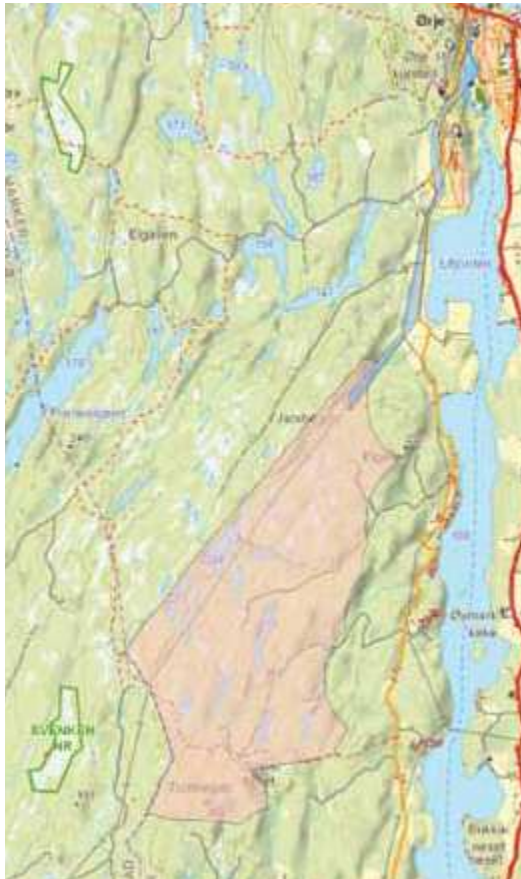
Kartutsnitt over området Elgåsen

Området Høgås på østsiden av Ørje omfattes av åsene Kalvemyrhøgda, Grytehøgda og Klevetjernåsen. Det planlegges her ca 20 turbiner av samme type som i Elgåsen. Disse blir liggende fordelt på hver sin åsside av Slorebyveien.